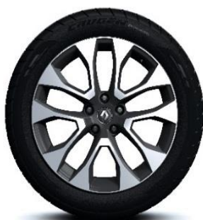
Алуминиумски тркала 19" Proteus