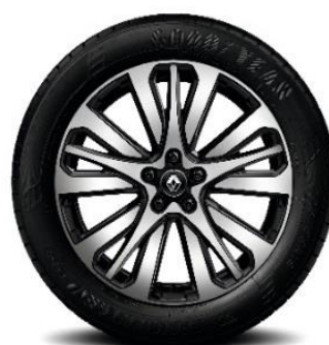
Алуминиумски тркала 19" Initiale Paris