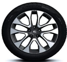
Алуминиумски фелни 19" Proteus