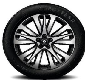
Алуминиумски фелни 19" Initiale Paris