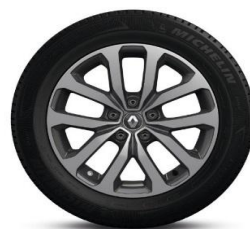
Алуминиумски фелни 17" Aquila Diamond Crna