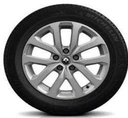
Алуминиумски фелни 17"