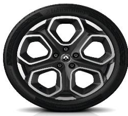
Алуминиумски фелни 19" Extreme