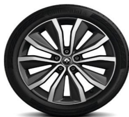
Алуминиумски фелни 19" Egeus