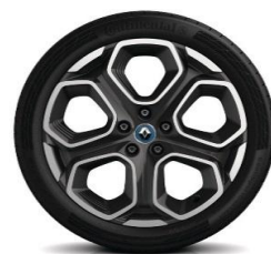
Алуминиумски фелни 19" Extreme Blue