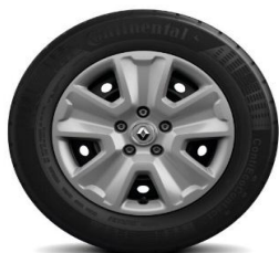
Челични фели 16" со украсни поклопци Pragma