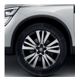
Алуминиумски тркала 19" Initiale Paris