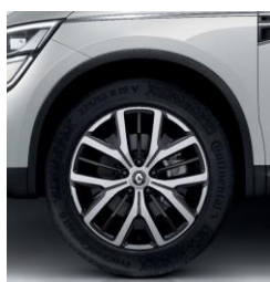
Алуминиумски тркала 19" Proteus