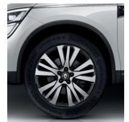
Алуминиумски тркала 19" Initiale Paris