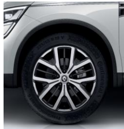
Алуминиумски тркала 19" Proteus