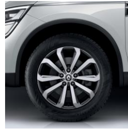
Алуминиумски тркала 19" Taranis