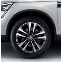
Алуминиумски тркала 18" Argonaute