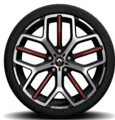
Алуминиумски тркала 19'' Trophy Akio