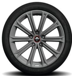
Алуминиумски тркала 18'' Estoril