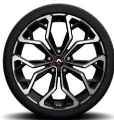
Алуминиумски тркала 19'' Diamond