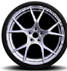
Алуминиумски тркала 19'' Trophy Forgee