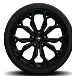
Алуминиумски тркала 19'' Diamond Black